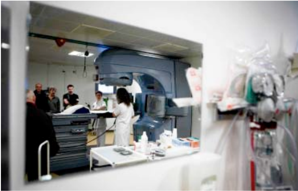
Arbejdet på hospitalerne er blandt de blodere områder, hvor engagementet og troen på vores offentlige velfærdssystem er det, der driver den enkelte til at arbejde med de svage medborgere. Er det forbeholdt kvinder at se mening med disse opgaver?