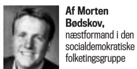
Af Morten Bødskov, næstformand i den socialdemokratiske folketingsgruppe

DA JEG læste Lene Espersens og Claus Hjort Frederiksen's udfald mod Helle Thorning-Schmidt, kom jeg til at tænke på det gode gamle ordsprog om ikke at kaste med sten, når man selv bor i et glashus. Men det bekymrer ikke regeringens desperate duo – skønheden og uhyret – som fortsætter med at kaste med sten efter socialdemokraternes formand.