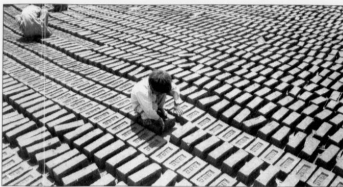
BØRNS FREMTID - Fattigdom og børnearbejde, som her i Pakistan, er til debat.

En ny ambitiøs handlingsplan, "A World Fit for Children" forventes vedtaget på FN's topmøde om verdens børn, der finder sted i New York i denne uge.