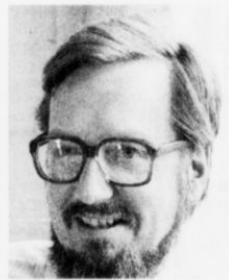
Per Stig Møller